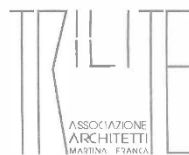
Associazione architetti "Il Trilite"