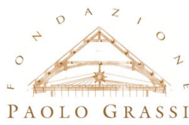
Fondazione Paolo Grassi