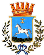
Comune di Martina Franca